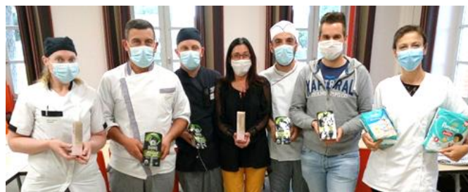
EHPAD Le Parc et l'Ostal de Garona, Escatalens (82)