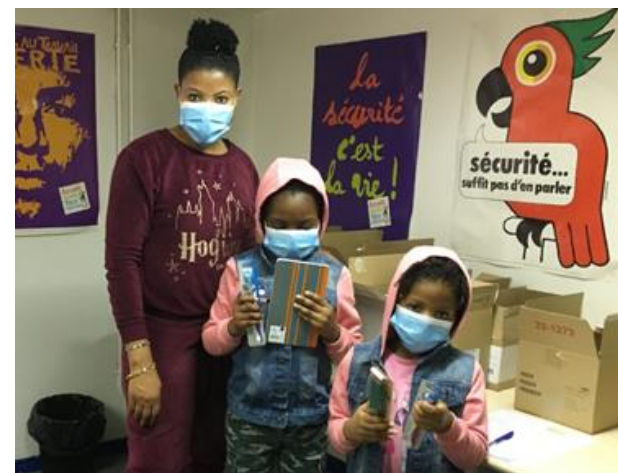
Association Emploi Développement (75)

Une coopération inter-associative réussie en faveur d'un public particulièrement fragilisé par la crise sanitaire.