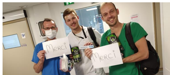
Equipe de réanimation, Hôpital de Roubaix (59)

« Je souhaite vivement vous remercier au nom de l'ensemble du personnel et des résidents pour le don de produits d'hygiène, de beauté, de vêtements que vous avez eu la générosité de nous envoyer. »