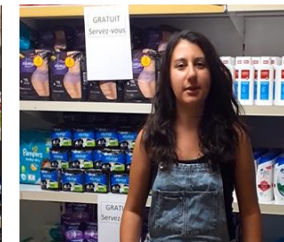
Association AESSEL (87)