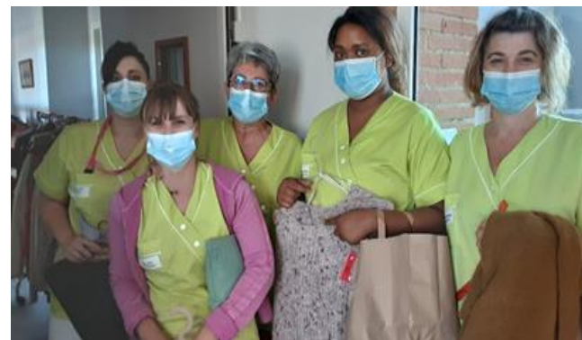
EHPAD Le Parc et l'Ostal de Garona, Escatalens (82)