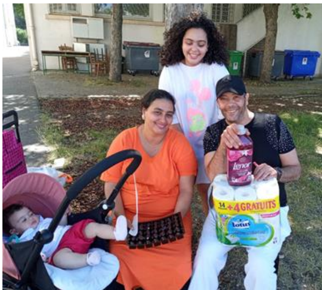
Association Together we Can (92)

« Merci encore de l'expédition de tous vos produits de qualité. Grâce à vos généreux donateurs nous avons pu remplir nos rayons malgré le confinement. »